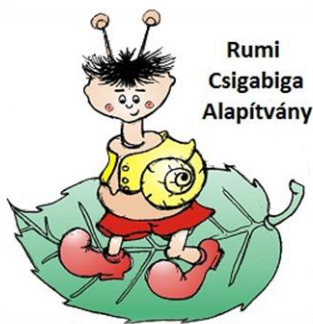
Rumi Csigabiga Alapítvány

2021 őszén a Rumi Csigabiga Alapítvány a FLEX Foundationhoz sikeres pályázatot nyújtott be, melynek eredményeként 13,5 millió Forint támogatást nyert egy új sportpálya létesítéséhez, mely 2022 tavaszán kerül kiépítésre iskolánk udvarán.